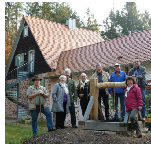
Fürther Team am Forsthaus Almen