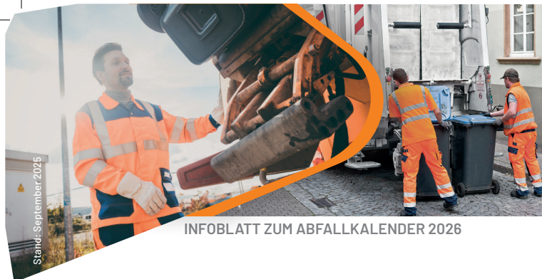
INFOBLATT ZUM ABFALLKALENDER 2026