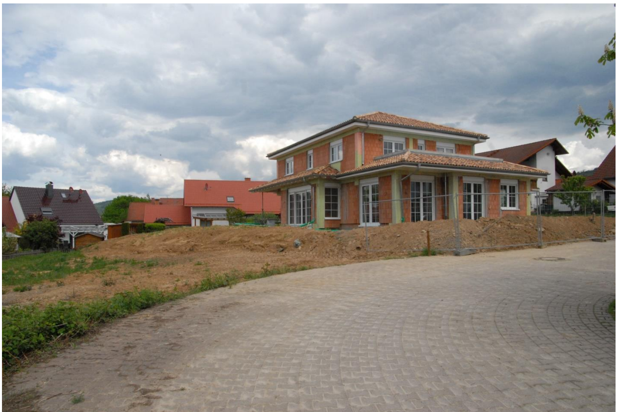
Foto 3 Baustelle auf Flurstück 234