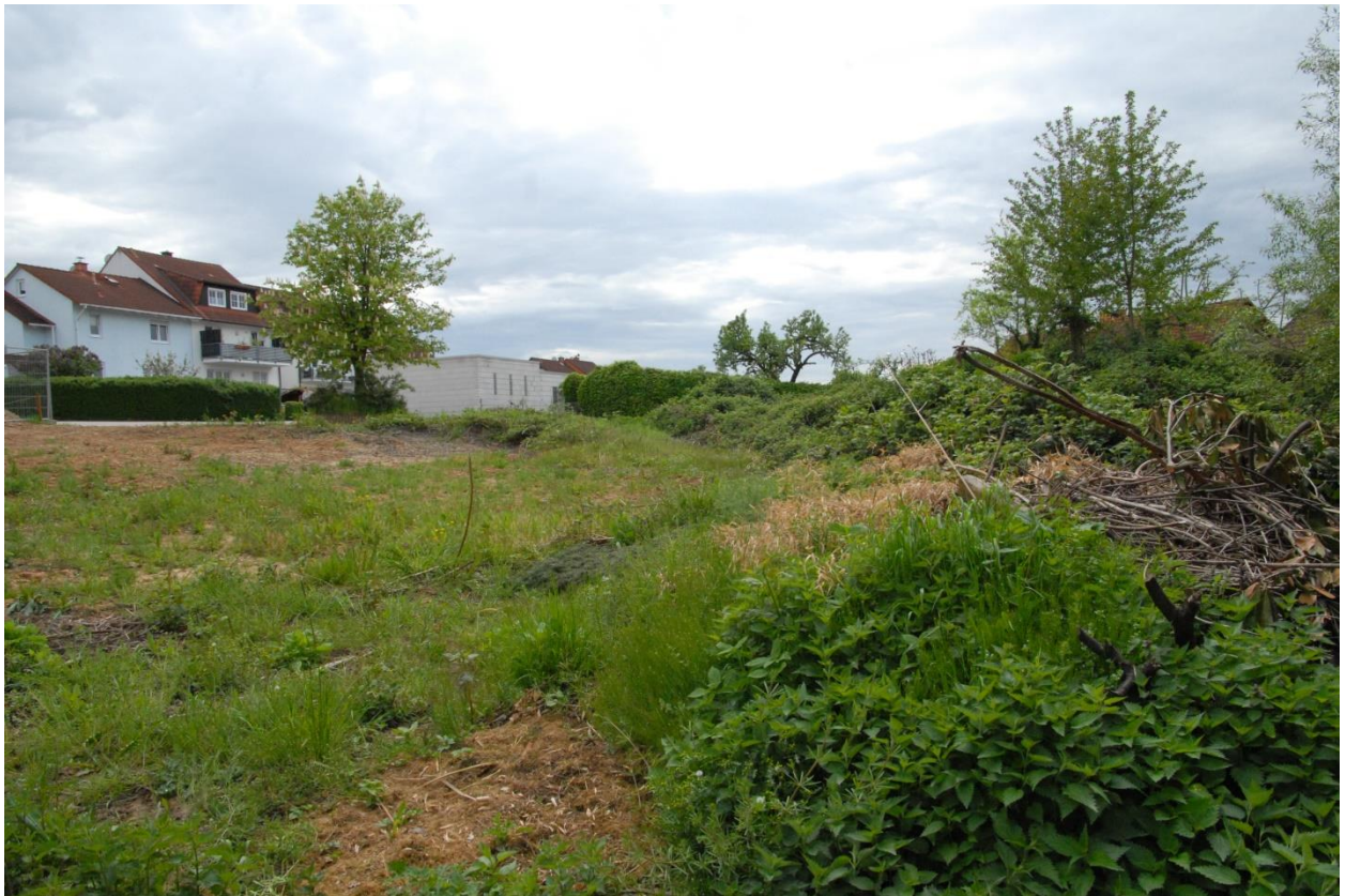
Foto 2 Flurstück 241 – durch Bauarbeiten auf Flurstück 234 gestört