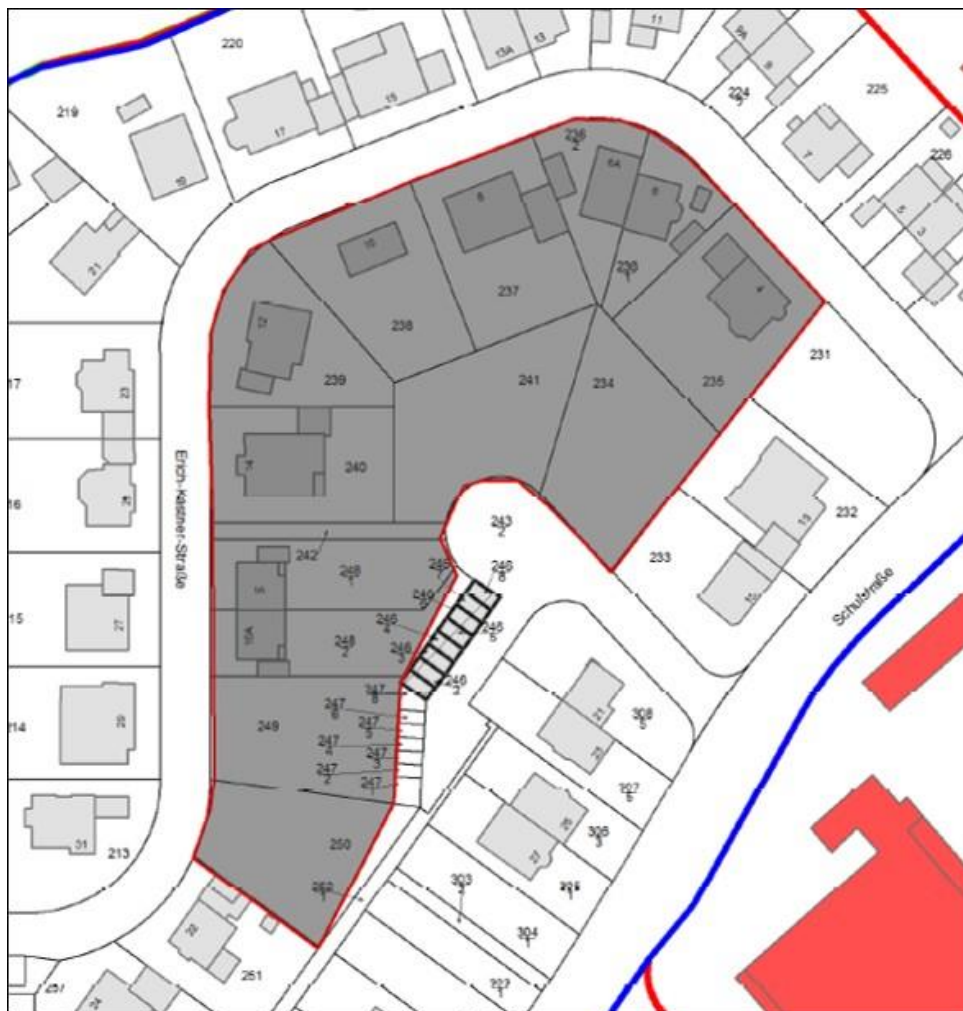
Abbildung 1 Geltungsbereich der Bebauungsplan-Änderung (im Mai 2021 von der Planungsgruppe Darmstadt übermittelt)

BfL wurde im Mai 2021 von Gemeinde Fürth im Odenwald mit der Erstellung des Artenschutzgutachtens zu der Bebauungsplan-Änderung beauftragt.