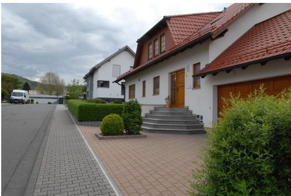
Foto 1 Wohnbebauung innerhalb des Änderungsbereichs